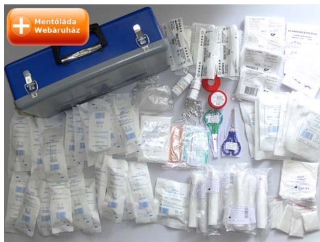
9. ábra. Kötszerek 10