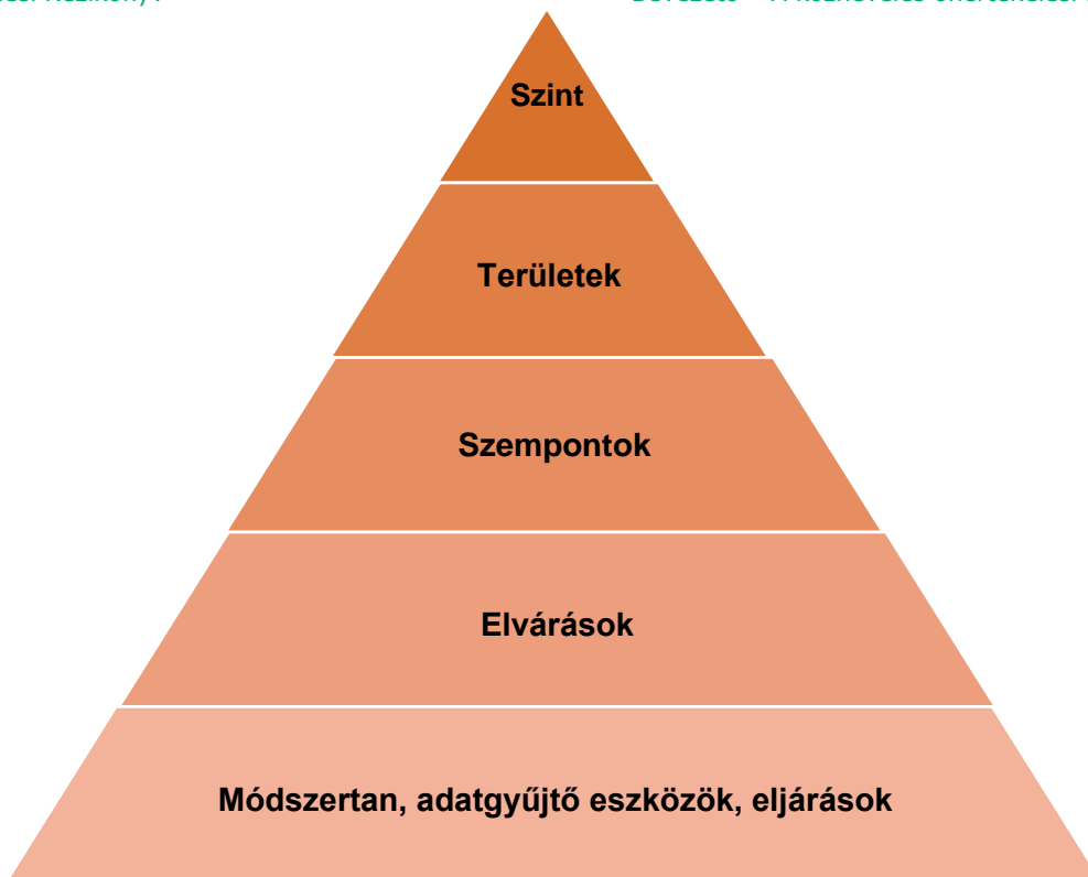
2. sz. ábra. Az önértékelési standard szerkezete