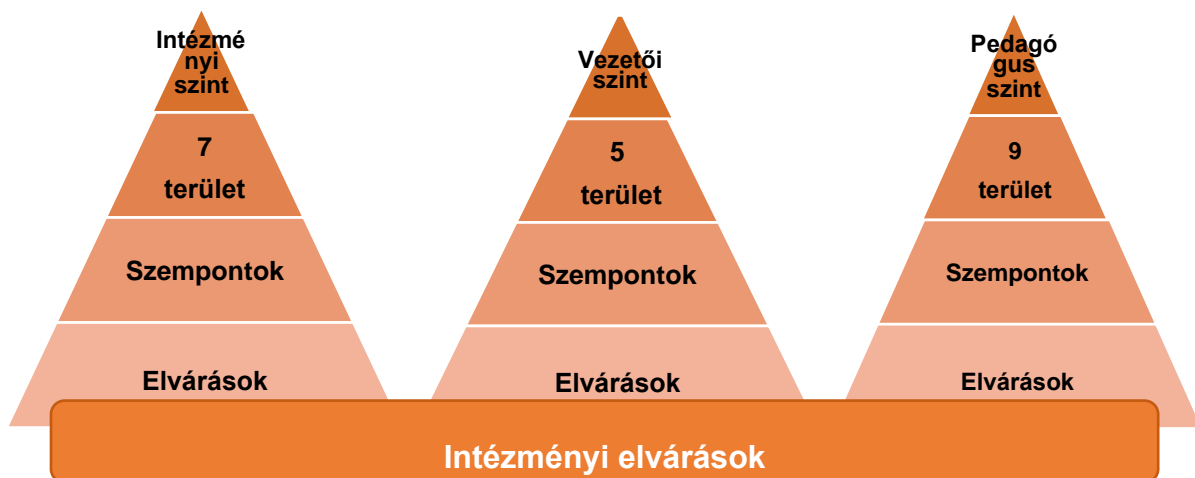
3. sz. ábra. A standard elvárásainak és az intézményi elvárások viszonya

Az általános elvárások értelmezését célszerű két lépésben elvégezni. Az első lépés kiindulópontját az intézményi dokumentumok (pedagógiai program/pedagógiai-szakmai munkáját meghatározó dokumentum, vezetői pályázat/vezetési program, alapító okirat, SZMSZ, éves munkatervék és beszámolók), és az intézményekben már működő pedagógus (teljesítmény)értékelési rendszer alkotják. Ezeket az adott általános elvárások szempontjából kell megvizsgálni, azonosítani kell az egyes általános elvárásokhoz kapcsolódó tartalmakat, és ahol azok alapján szükséges, ott meg is kell fogalmazni az intézményi értelmezés alapján az intézményi elvárást. A második lépés a dokumentumokban nem, vagy csak közvetetten megjelenő elvárások értelmezése, ami az intézményben kialakult szokásokra, alkalmazott gyakorlatokra és módszerekre épül, így az értelmezésbe ebben a szakaszban már be kell vonni a nevelőtestületet.