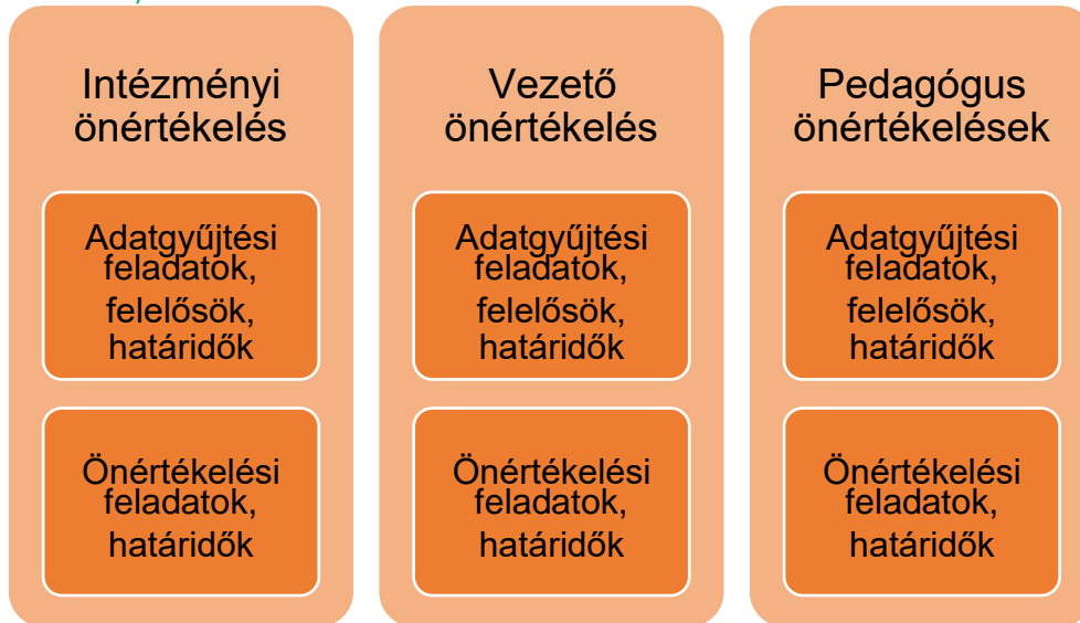
5. sz. ábra. Az éves önértékelési terv ajánlott szerkezete